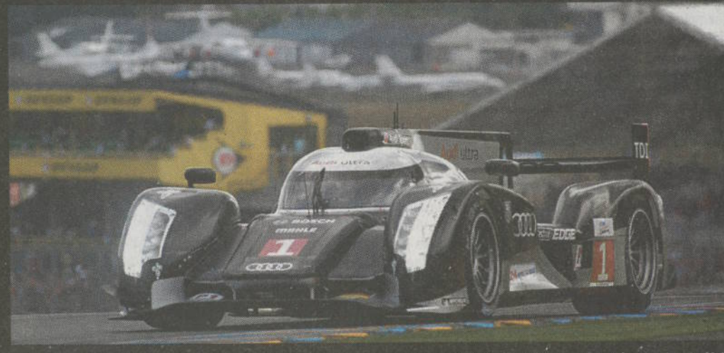
LE MANS, 11 JUIN 2011. - Dans la Sarthe, en juin dernier, Romain Dumas pilotait l'Audi R 18 portant le numéro 1, dû à sa victoire dans la classique mancelle en 2010 avec Mike Rockenfeller et Timo Bernhard.

vé. En 2008, Romain Dumas devient patron d'équipe : quelques copains, « pas spécialistes », tous bénévoles, un copilote, meilleur ami, qui n'avait jamais envoyé de notes, un petit camion, une remorque, quelques caisses à outils et sa voiture, une Porsche, le tout basé au pôle mécanique d'Alès, pour disputer quatre ou cinq rallyes par an. « Je fais ça en amateur éclairé. Pas pour l'argent mais pour m'amuser avec mes copains. On descend dans le même gîte, on met tous les mains dans le cambouis et s'il faut faire à manger, il y en a un qui s'y colle. Mes parents sont mes ouvriers. » En 2010, il monte en gamme, s'offre